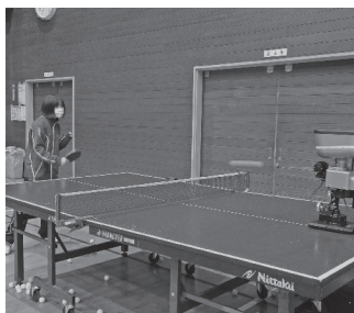
本校卓球部の練習の様子