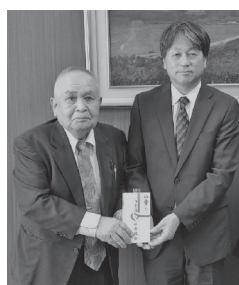
令和5年11月9日校長室にて